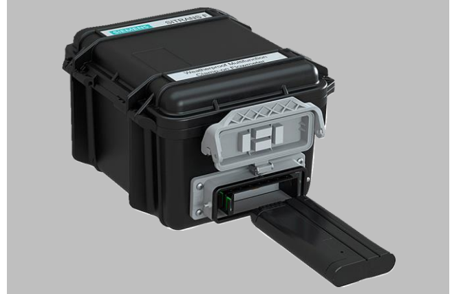
Transmetteur SITRANS FST090 avec batterie