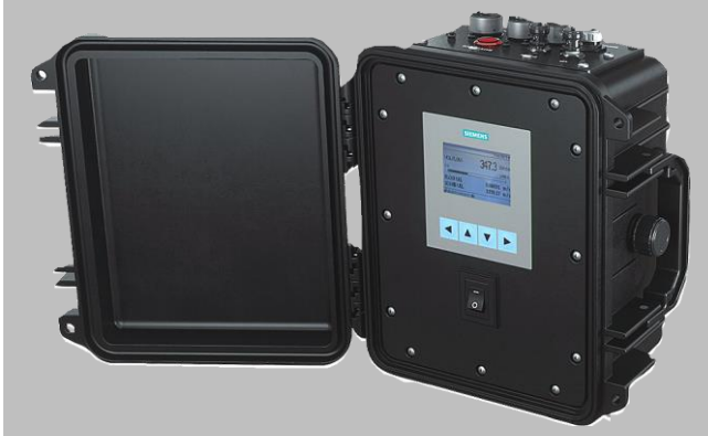
Débitmètre à ultrasons clamp-on SITRANS FST090

Le système de mesure de débit à ultrasons clamp-on portable SITRANS FS290 est constitué du débitmètre clamp-on portable SITRANS FST090 et de capteurs FSS200.